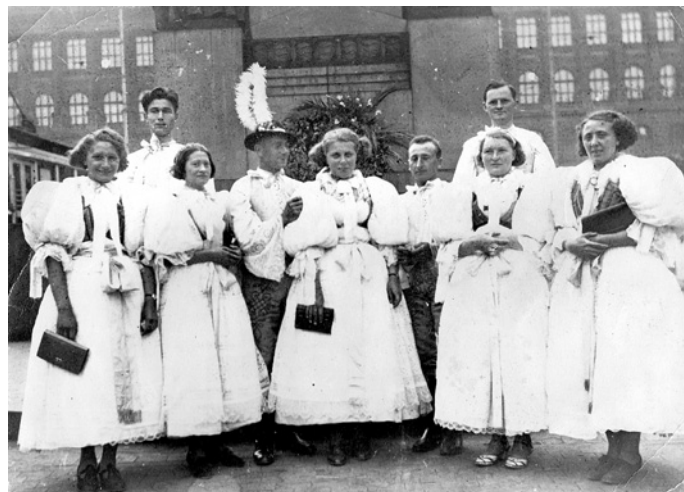
„Hochštecká“ reprezentácia na Sokolskom zlete v Prahe v roku 1935.