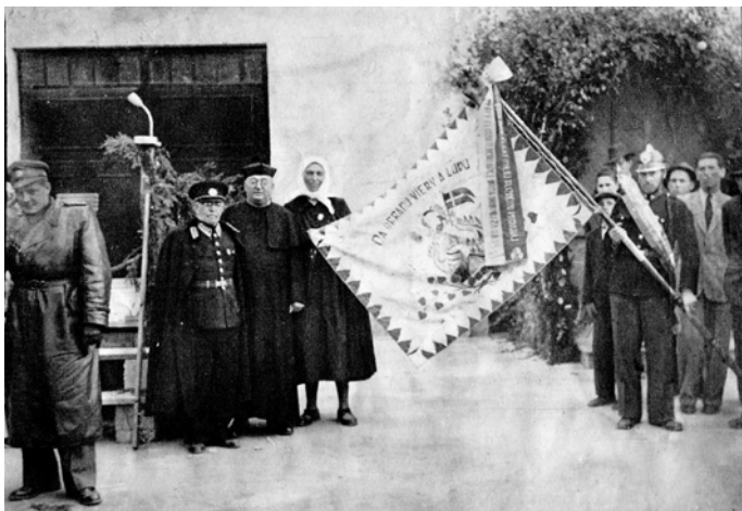
Vysvätenie hasičskej zbrojnice a zástavy - r. 1948