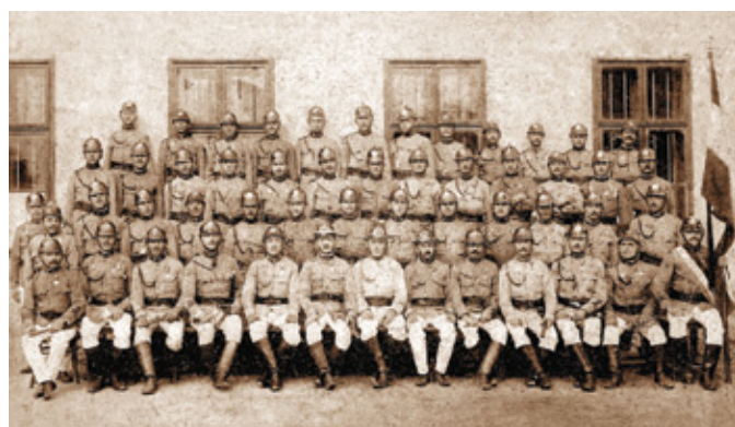
Dobrovoľný hasičský zbor Hochštetno - r. 1910

Z roku 1910 sa dochovala cenná historická skupinová fotografia, na ktorej je vidieť 52 – členný dobrovoľný hasičský zbor obce Hochštetno. Tak ako historické pramene uvádzajú, dá sa z fotografie usúdiť, že v spolku bola náležitá disciplína. Jednotné uniformy belasej farby s modrým prúžkovaním, biele nohavice, čierne čizmy s tvrdými holičkami. Helmy boli z kože, zdobené mosadzným plechom so znakom Rakúsko – Uhorska, ktoré boli neskoršie vymenené. Snímka bola urobená na dvore starej, vtedy novej rímsko – katolíckej ľudovej školy.