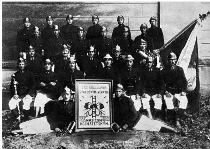
Dobrovoľný hasičský zbor Hochštetno - r. 1930

V prvej kronike hasičského spolku, ktorá sa našťastie uchovala, a je stále opatrovaná na obecnom úrade, je zaznamenané: „V zdraví a v pohode v ďalšom období budeme naďalej plniť svoje povinnosti, svoje sily spojíme v pokorení ničivých plameňov“, toto heslo si ctia a zostávajú mu verní aj súčasní hasiči.