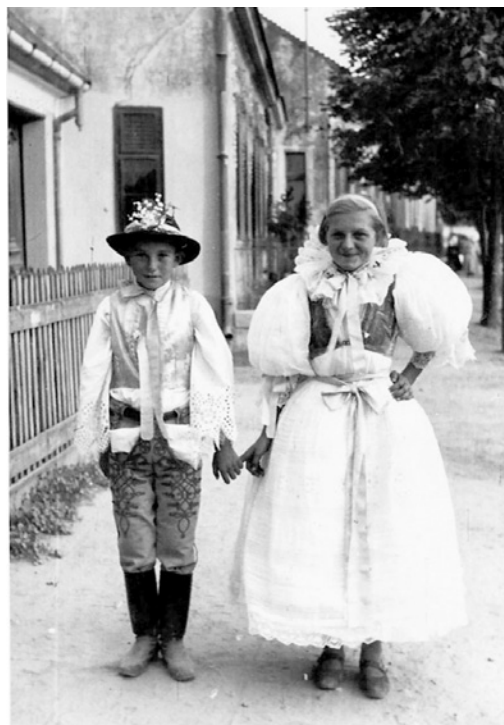
Deti oblečené v miestnom ľudovom kroji pri príležitosti návštevy ministra spravodlivosti Dr. Ivana Dérera v roku 1938.