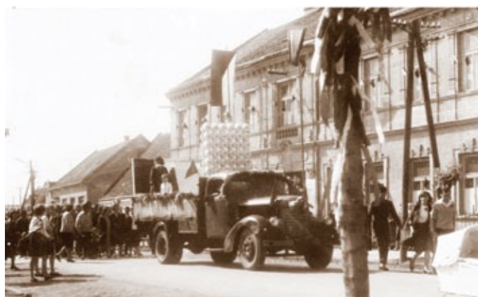
Alegorický voz textilnej fabriky vo Vysokej pri Morave v prvomájovom sprievode. 60- te roky

Dejiny textilnej fabriky sa začínajú písať krátko po II. svetovej vojne. Vláda ČSR prijala uznesenie, na základe ktorého mali byť z česko-nemeckého pohraničia demontované priemyselné podniky. So zámerom spriemysleň slovenskú časť republiky mali byť fabriky zo sudetských Čiech znovuinštalované vo vybraných obciach a mestách na Slovensku. Zámery československej vlády korešpondovali s požiadavkami miestneho