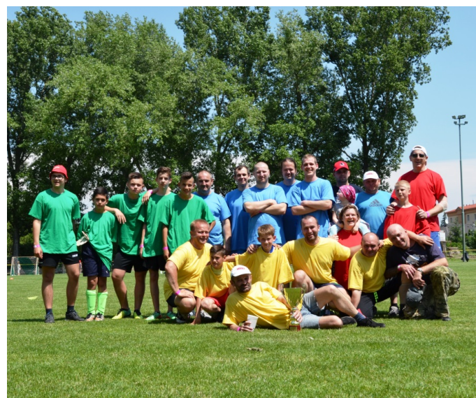
Futbalové družstvá na 3. Berto športovom dni.

Viac informácií nájdete na www.berito.sk alebo nás sledujte na Facebooku Berto – Poctivé mäsiarske remeslo.