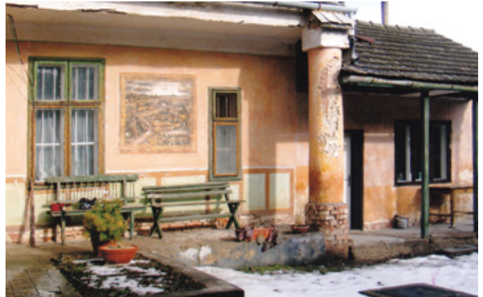
Pohľad do dvora vidieckeho secesného domu