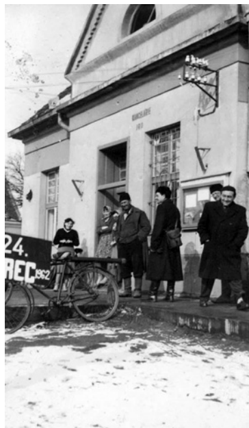
niekdajšia budova JRD, dnešný dom služieb 24. marca 1962