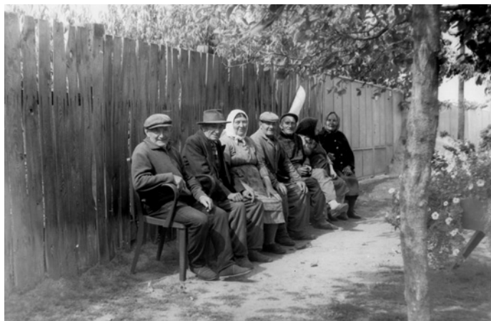
odpočinok v tieni stromu