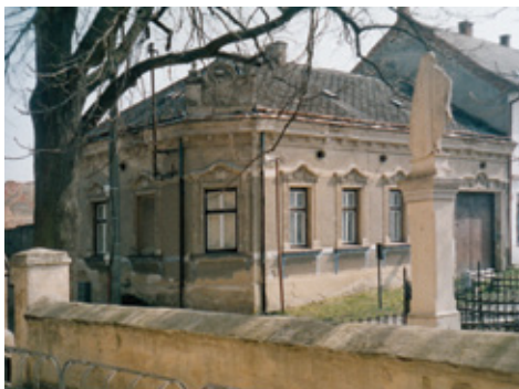
Secesný dom na Hlavnej ulici 1

Architektúra je najbezprostrednejší druh umenia, ktorý sa každému vtlačá do jeho pozornosti. Chtiac nechtiac je súčasťou našich životov, odzrkadľuje aktuálny vkus, vyjadruje politickú a spoločenskú