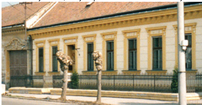
Secesný dom na Hlavnej ulici 2

Na konci 19. storočia sa začal klásť dôraz na reguláciu a plánovanie zástavby miest. S tým súviseli asanácie podľa parížskeho vzoru, ktoré pozostávali z búrania a následného stavania vyhovujúcejších budov, rozširovania ciest, stavby vodovodov a elektrifikácie ulíc. Tento nový trend však na vidiek neprenikol, a tak si dediny zachovali svoje pôvodné gotické usporiadanie. V architektúre prevládala v tomto období tzv. historizujúci sloh, ktorý čerpal zo starších architektonických slo-