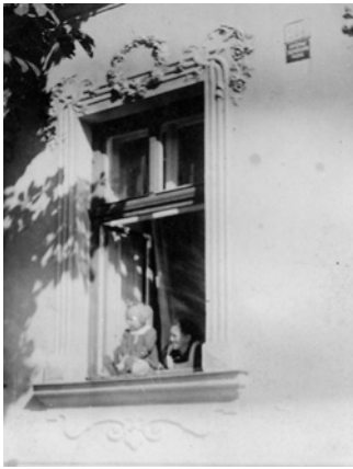
detail ornamentácie okna

alebo moderný štýl, nemčina ako Jugendstil (mladý štýl). Je výrazom odpútania sa od historickej architektúry a protestom voči konzervatívne akademizmu. Pre secesiu je typické bohaté zdobenie fasád a interiérov rastlinnými a mytologickými motívami, rozmanitá farebnosť, vitrážové okná, ozdobné zábradlia a vybavenie interiéru v duchu nového slohu. Vnútorne zariadenie týchto bytov často zodpovedalo vonkajšej ozdobnosti. Bežnými sa stali ornamentálne tapety, masívny vyrezávaný nábytok alebo krištáľové lustre. Avšak podobne zariadené domy si mohli dovoliť